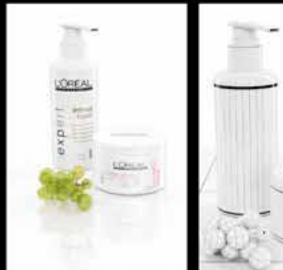
Réalisme d'un packshot 3D.