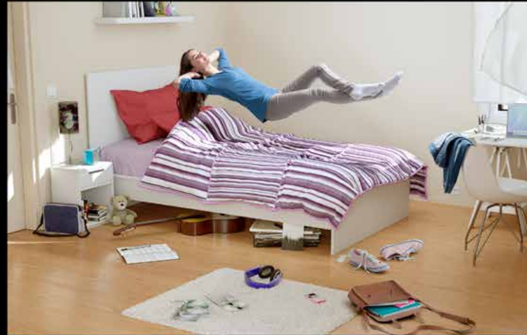
Décor 100% virtuel et modèle 100% décontracté.