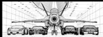
Extravagance publicitaire rendue possible grâce à la modélisation 3D.