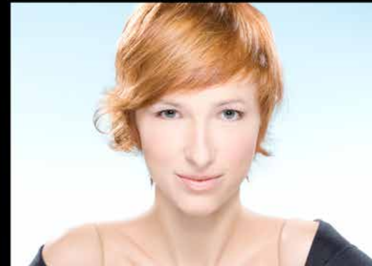
Vous êtes plutôt spontanéité ou sophistication ?