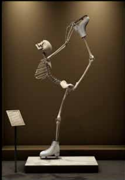
Démonstration de la souplesse de la 3D.